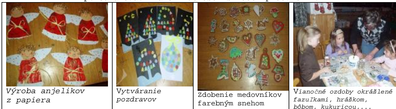
Výroba anjelikov z papiera