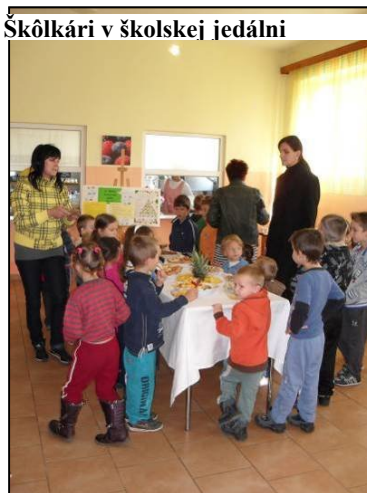
Škôlkári v školskej jedálni